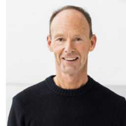
Thomas Rabe Bertelsmann Yönetim Kurulu Başkanı ve İcra Kurulu Başkanı ve RTL Grubu İcra Kurulu Başkanı